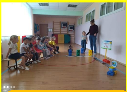
«Где ты живешь?»