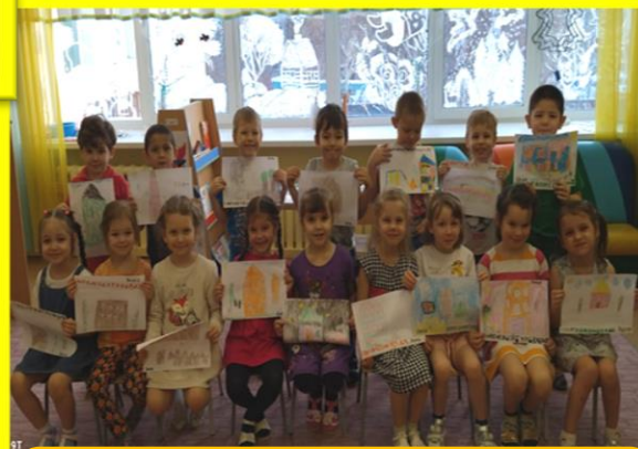
«Дом в котором я живу»