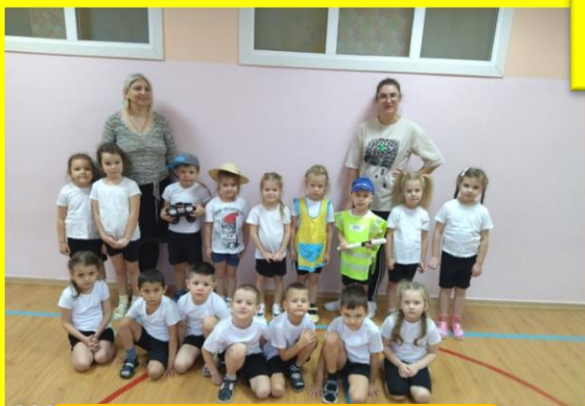
«Если я потерялся на улице»